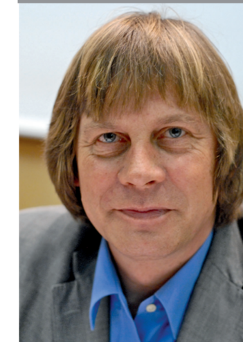
Bernard Thibault, secrétaire général de la CGT

A l'issue d'une négociation laborieuse avec les organisations patronales, un accord a été conclu avec des syndicats de salariés. Le journal que vous avez entre les mains a pour objectif de vous informer, de vous alerter, mais aussi d'en appeler à votre intervention avant que de mauvaises décisions ne soient prises. En prenant connaissance de